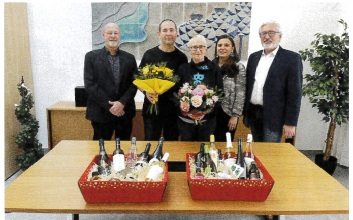
Verabschiedung im Sitzungssaal